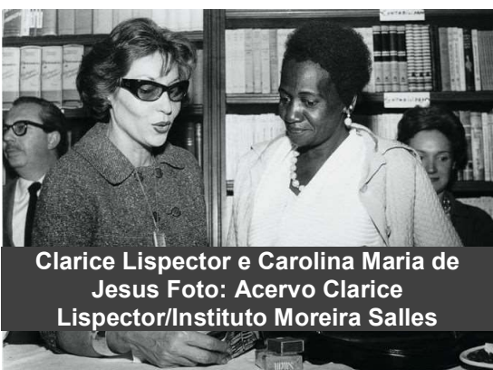
Clarice Lispector e Carolina Maria de Jesus

Mas como a casa grande surta quando a senzala aprende a ler, Carolina foi até presa e acusada de bruxaria por seu letramento. Acabou migrando para São Paulo, em meados da década de 40, com sua primeira filha. No início, trabalhou como empregada doméstica e foi morar na favela do Canindé, zona norte da capital. Depois, passou a catar papel para sobreviver e sustentar seus três filhos sozinha. Dos materiais que recolhia, separava cadernos e folhas para poder escrever.